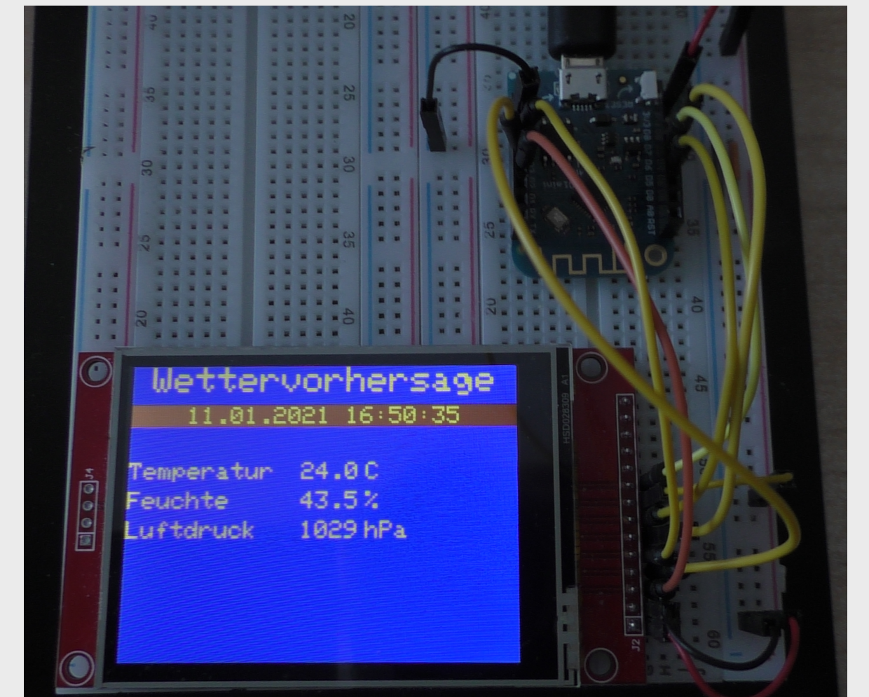
Smartdisplay mit ESP8266